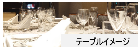
テーブルイメージ