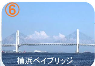
横浜ベイブリッジ