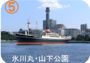
氷川丸・山下公園