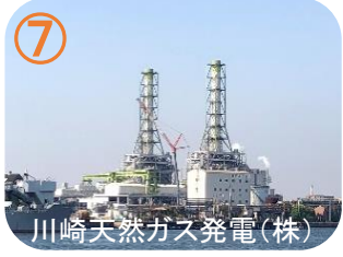
川崎天然ガス発電(株)