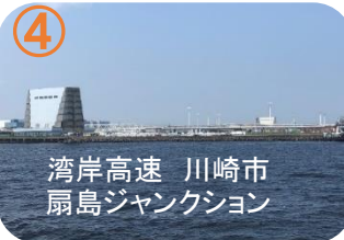
湾岸高速 川崎市 扇島ジャンクション