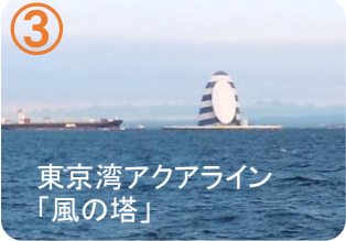
東京湾アクアライン 「風の塔」